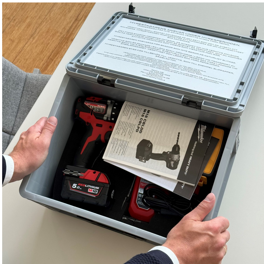
Lådan med verktyget som man kan hyra från ett smart skåp.

— Vi kan inte direkt kampanja oss in på marknaden för det måste finnas ett behov först och när behovet dyker upp ska vi ligga med i medvetenheten hos kunden. Att hitta de yngre är viktigt för de är mer öppna för att hyra istället för att äga, säger han.