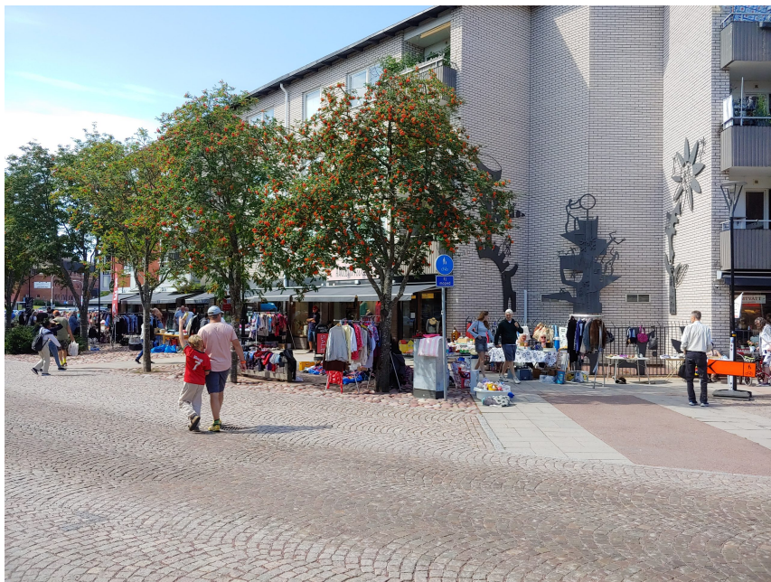
Loppmarknaden vid Fridhemsplan har blivit en given del under "Sommartorsdagar" i Mora.

Aktiviteternas avsikt har varit att värna om den mångfald av intressen som finns, från när och fjärran.